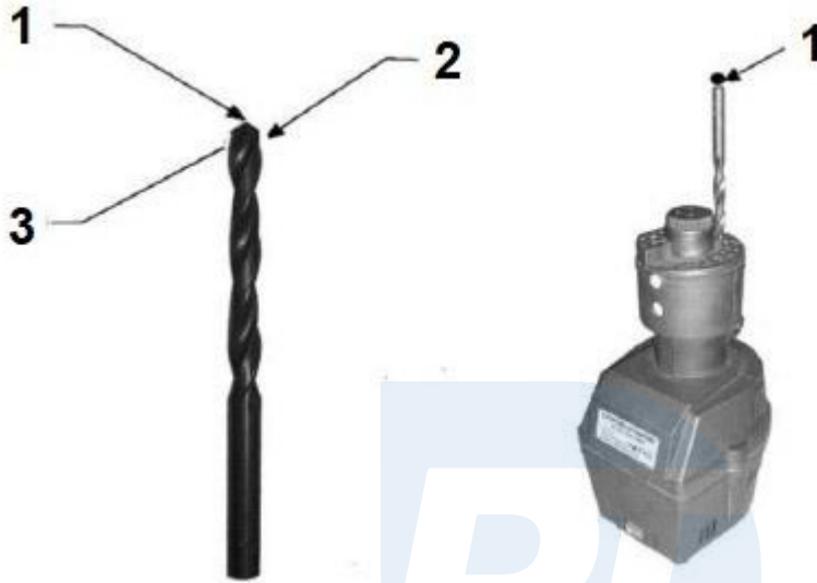
1. ábra 2. ábra